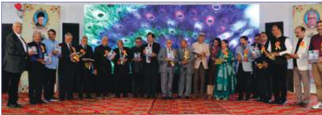
Sood Parivar Magazine released by Sood Sabha Hoshiarpur on the occasion of Sood Milan Divas.