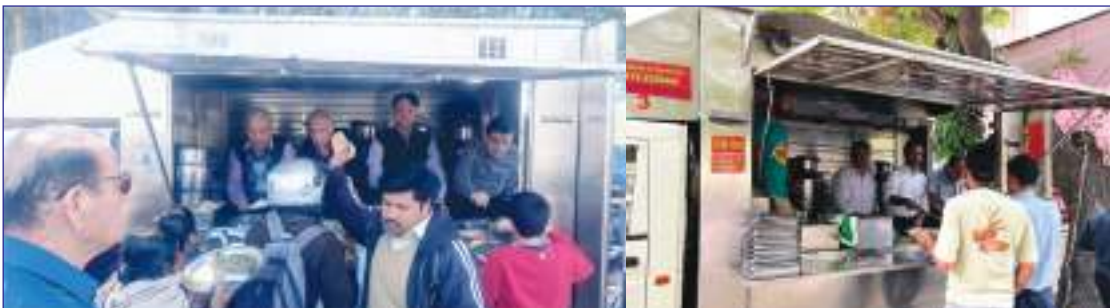
Bhandara organised by Sood Sabha & SSBT at Chandigarh & Panchkula