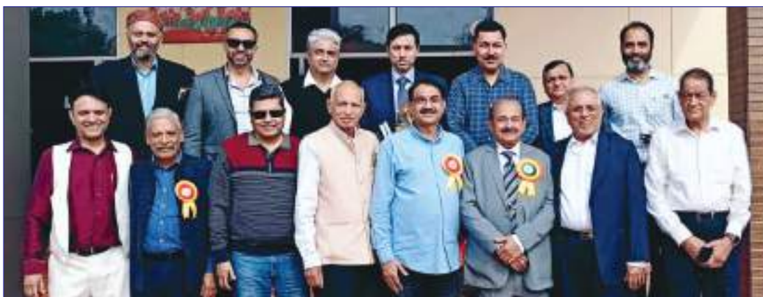
Members of Sood Sabha Chandigarh with President Sood Sabha Hoshiarpur on the occasion of Sood Milan Divas.