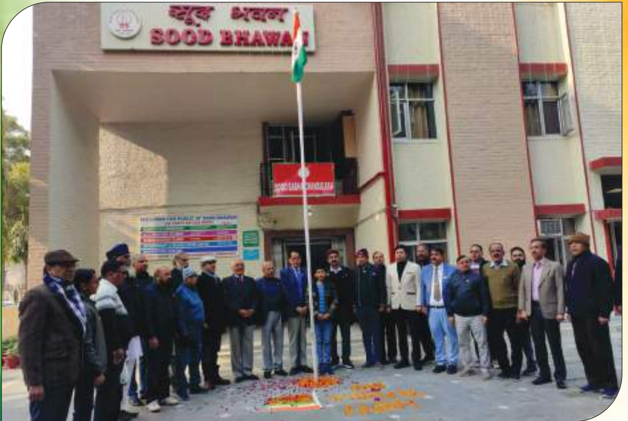
Office bearers and Members of Sood Sabha Chandigarh celebrating 75th Republic Day by hoisting National Flag at Chandigarh Bhawan

• Sood Sandesh ₹ 500/- (Membership for ten years)