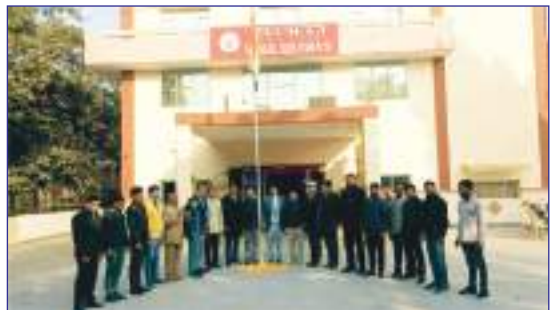
Celebration of 75th Republic Day at Sood Bhawan Panchkula