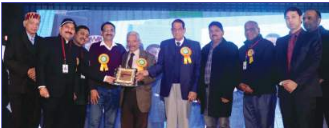
Honouring of President Sarvadeshik Sood Sabha and President Sood Sabha Chandigarh on occasion of Sood Milan Divas organised by Sood Sabha Sirhind.